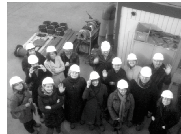
Vizită de lucru la Centrul de Formare Profesională VET al FABRICOM – Anvers

În perioada 18-22 martie 2013, Ministerul Educației din Flandra, Belgia a organizat în Bruxelles și Anvers o vizită de studiu cu tema „Inovare, industrie și educație în perspectiva regională”.